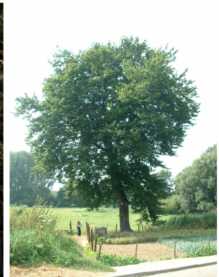
, 20 Août 2003