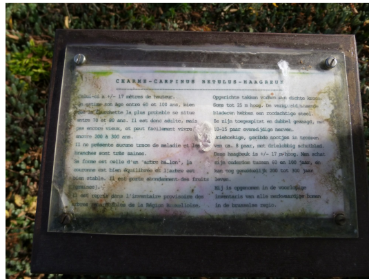
, 08 Octobre 2013