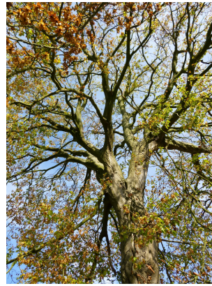
, 08 Octobre 2013